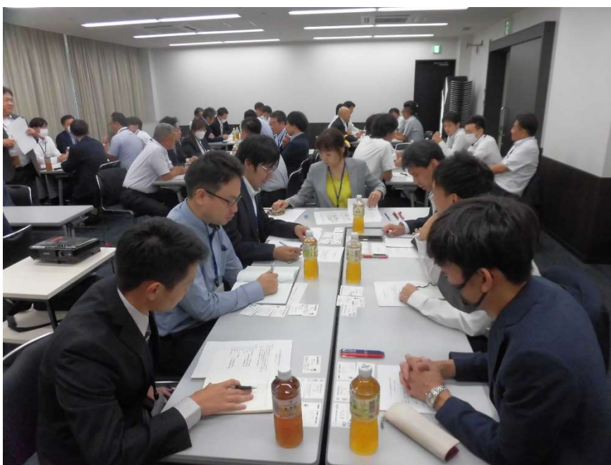
第8回営業現場最前線担当者向け研修会の様子

令和5年9月26日(火)、大阪科学技術センターにおいて、営業現場最前線担当者向け研修会を開催しました。参加者は49名でした。本年度は数えて8回目となり、昨年引き続き、品質保証部門の方々にもご参加いただき、営業部門の方々と活発な意見交換を行いました。