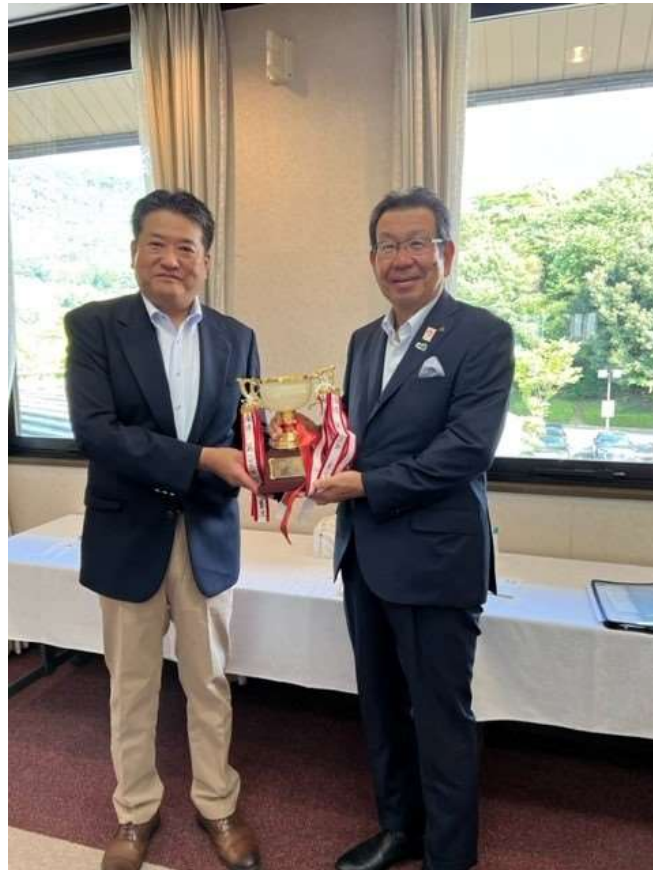
第184回西部会ゴルフコンペでの表彰式の様子