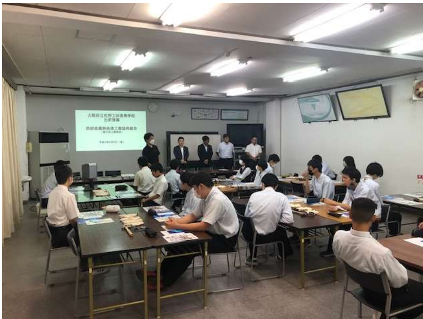
大阪府立佐野工科高等学校での出前講座の様子

令和5年9月8日(金)、大阪府立佐野工科高等学校において、熱処理技術の魅力伝える出前講座を実施しました。参加生徒数は72名でした。