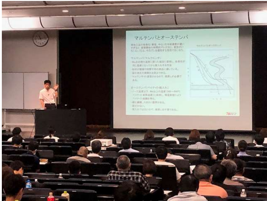
大阪科学技術センター大ホールでの金属熱処理技能検定学科試験講習会の様子

ち組合会員企業からの受検者は2級が35名、3級が3名)、高周波・炎熱処理作業での受検者は2級が25名、3級が3名(うち組合会員企業からの受検は2級が13名、3級が2名)でした。