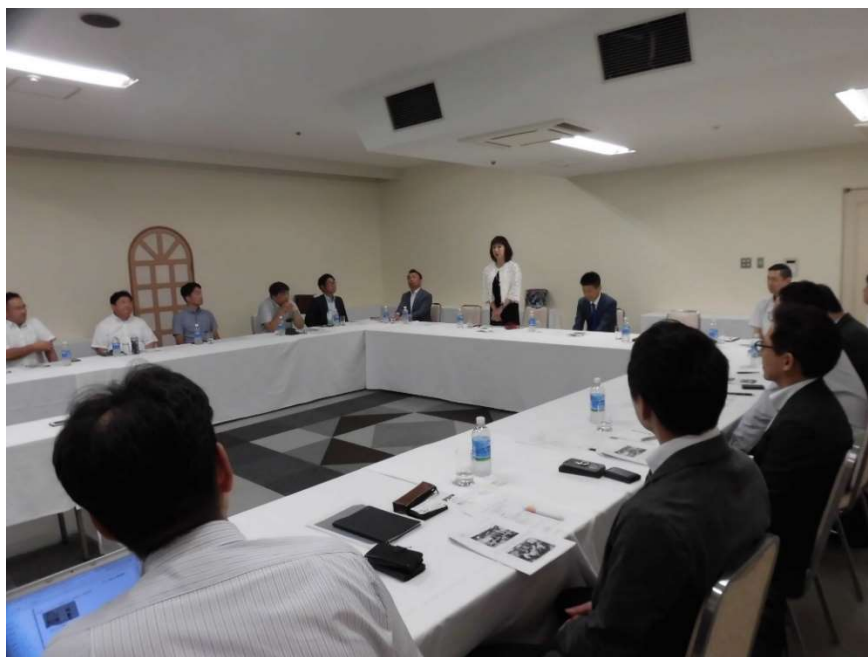
広島ガーデンパレスでの第1回魅力向上委員会の様子