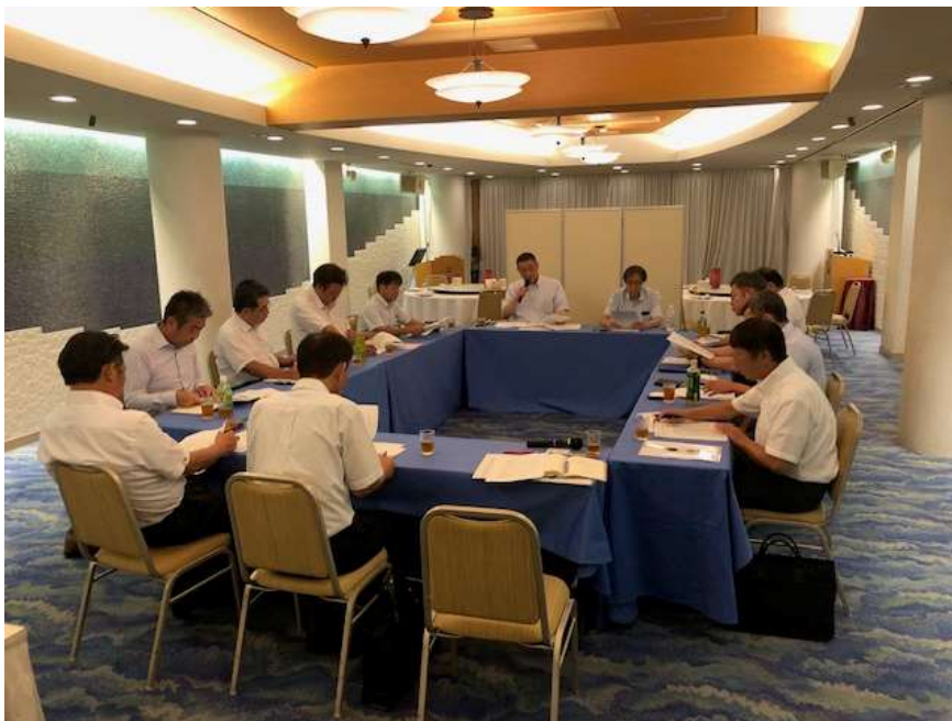
道頓堀ホテルでの第1回マーケティング委員会の様子

令和5年7月20日(木)、道頓堀ホテルにおいて、第1回マーケティング委員会を開催しました。