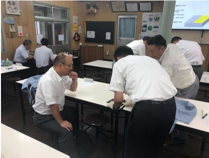
研修会での先生方への出前講座デモンストレーションの様子